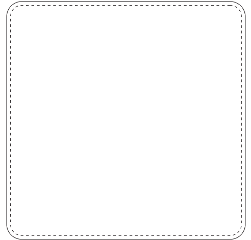
正方形 W60 x H60mm