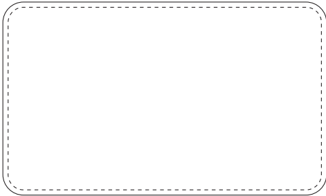
長方形 W60 x H35mm