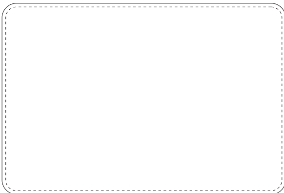
長方形 W75 x H50mm